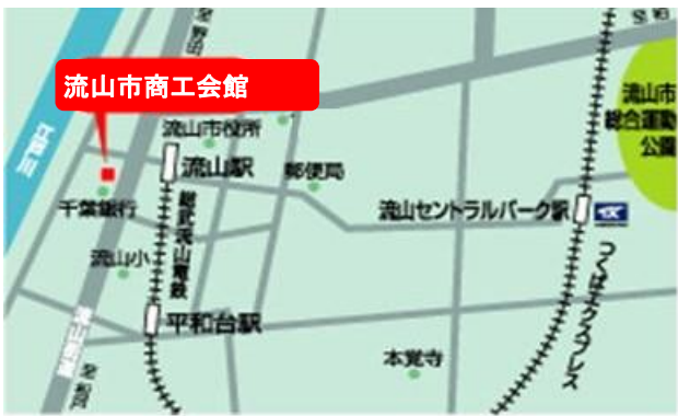
流山市商工会館 〒270-0164 千葉県流山市流山2-312 (流山駅より徒歩1分)